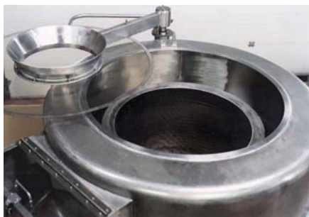
Крышка на вращающейся задвижке