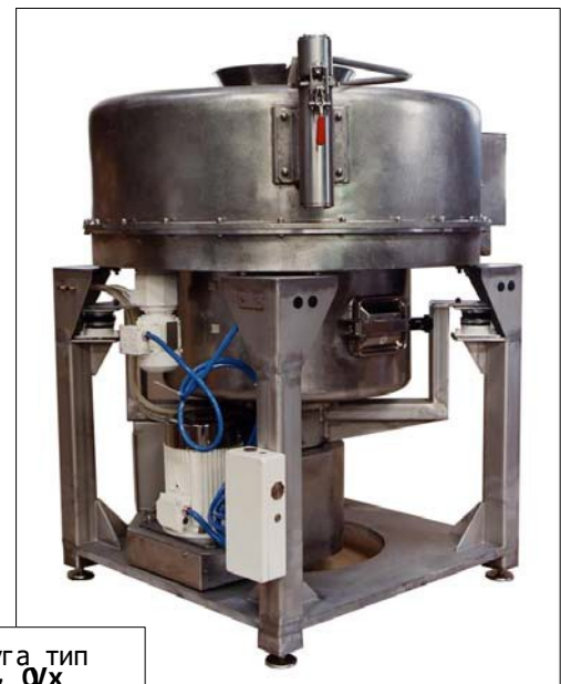
Центрифуга тип RСРС 7 Vх

Центрифугу RСРС 60 Vх можно легко адаптировать и установить прямо на перерабатывающем заводе так, чтобы она наиболее соответствовала перерабатываемому продукту, с помощью изменения скорости и циклов выгрузки.