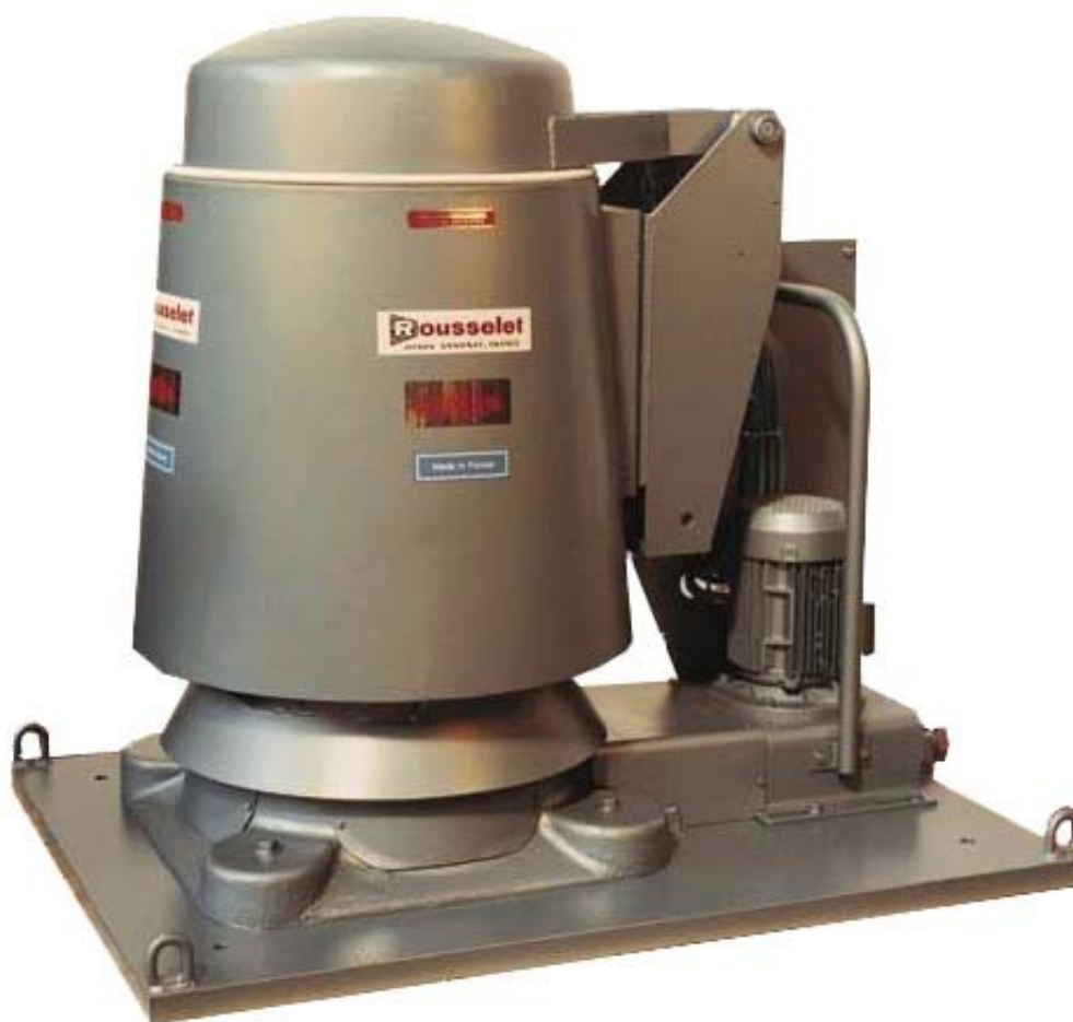
Вид RC 60 KG с автоматическим управлением барабана

Гидро экстрактор со съёмным барабаном. Для сокращения времени на операцию осушительная фаза начинается сразу после закрытия крышки. Лишний материал устраняется через нижнюю часть механизма.